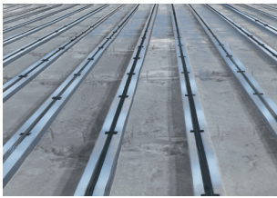
导轨型平台的施工例